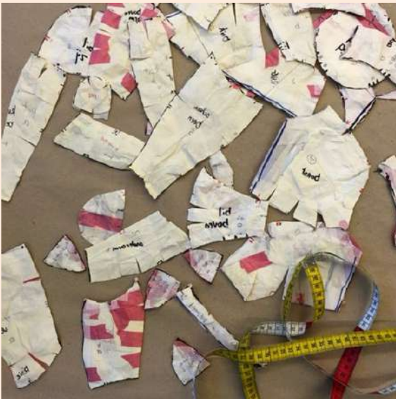
Patronen (ontworpen door Katinka Heremans)