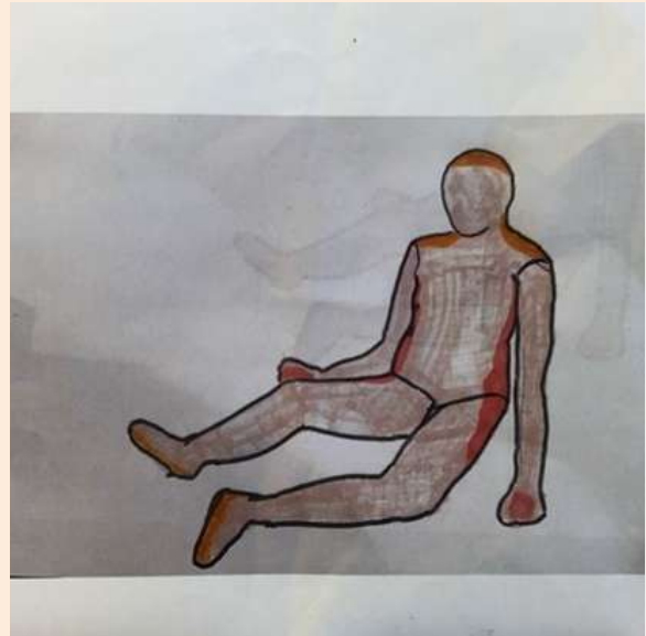
Schets POPPY (ontworpen door Rosa Schützendorf )